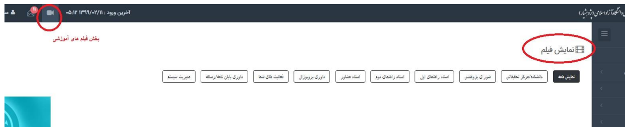
شکل ۵) بخش فیلم های آموزشی در سایت پژوهشیار