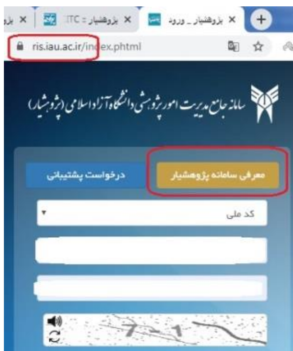
شکل ۱) صفحه ابتدایی سامانه جهت ثبت نام، دریافت کمک، و ورود به حساب کاربری