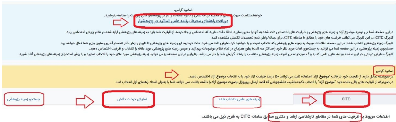
شکل ۲) صفحه ابتدایی ورودی اساتید که در آن می توان زمینه پژوهشی را انتخاب کرد